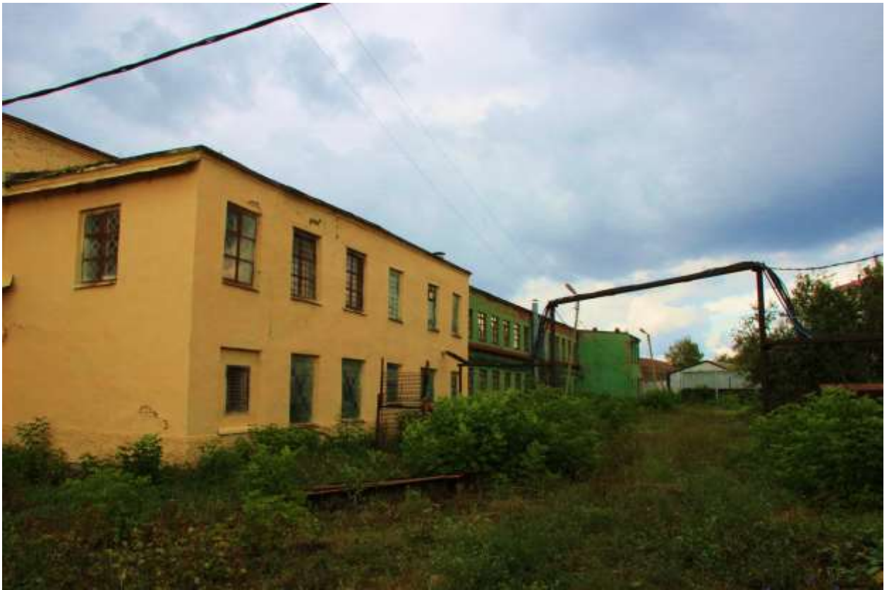
Основной производственный корпус, вид изнутри